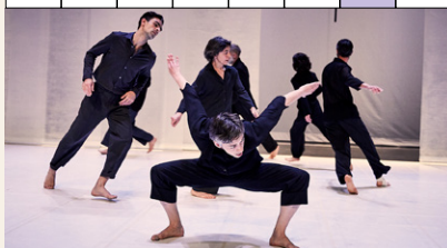
ON GOLDBERG VARIATIONS