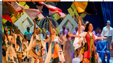
CÉSAR MANRIQUE, EL MUSICAL